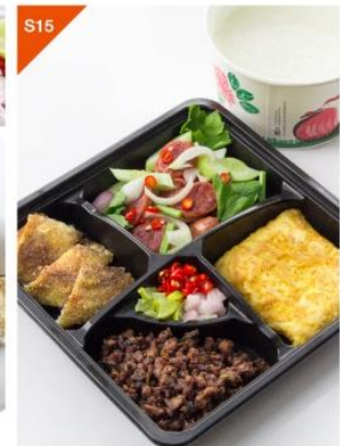
S15 หูดข้าวต้มก๊วยๆ Rice Porridge with Fried Gourami, Stir-Fried Minced Pork with Salted Olives, Omelet with Pickled Turnip and Yum Chinese Sausage 210.- 199.-