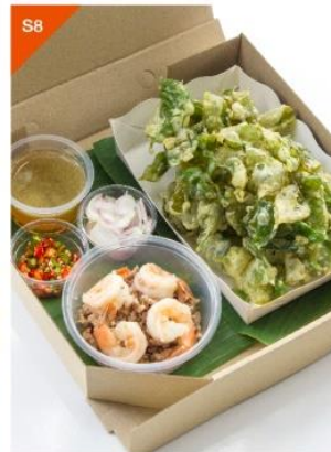
S8 ยำเบญจรงค์คออร์แกนิกกรอบ Spicy Crispy Organic Chinese Violet Salad 280.- 199.-