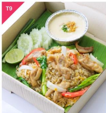
T9 ข้าวพัดไก่หอมกระเทียม + ไข่ตุ๋นนุ่มสลัดสลัดขี้ปูน Aromatic Chicken Fried Rice and Steamed Egg