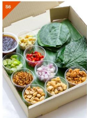
S6 เมี่ยงคะน้า + เมี่ยงคำใบชะพลู Herbs Wrapped in Chinese Broccoli Leaves / Wild Betel Leafbush 220.- 190.-