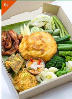
S2 น้ำพริกไข่ปู + สร้อยไก่ทอด + ไข่เจียวห่อข้าว Namprik Kaipoo (Crab Egg Yolk Chili Paste) with Chicken Tenders, Omelet and Rice 325.- 199.-