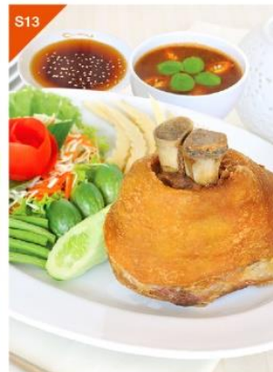
S13 ขาหมูกรอบแกงไตปลา Deep-Fried Pork Leg with Southern-Style Fish Curry Sauce 450.- 399.-