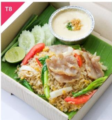
T8 ข้าวพัดหมูหอมกระเทียม + ไข่ตุ๋นนุ่มสลัดสลัดขี้ปูน Aromatic Pork Fried Rice and Steamed Egg