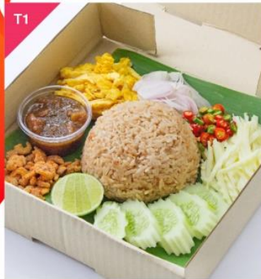
T1 ข้าวคลุกกะปิทรงเครื่อง Shrimp Paste Fried Rice with Omelet Strips, Caramelized Pork, and Sour Mango

อร่อยอยู่บ้านแบบไม่จู้จี้ กับเมนูทำสดๆ ร้อนๆ โดย อ.มลลิกา