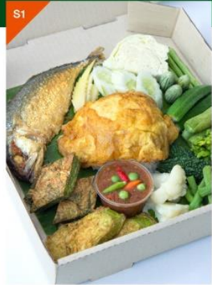
S1 น้ำพริกกะปิปลา + ไข่เจียวห่อข้าว Namprik Kapi (Shrimp Chili Paste) with Omelet and Rice 299.- 199.-

ส่งจาก เกษตร-นวมินทร์ เปิดให้บริการ 10.30-20.00 น. สั่งได้ที่ Tel. 02-946-1000, 084-088-3759 LINE @a.mallika