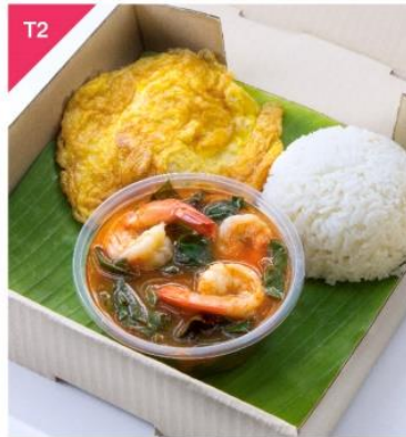
T2 แกงส้มกุ้งเบญจรงค์ออร์แกนิก + ไข่เจียว + ข้าวสวย Gangsom Shrimp and Organic Chinese Violet with Omelet and Rice