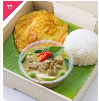
T7 แกงเขียวหวานไก่ (พริกแกงทำเอง) + ไข่เจียว + ข้าวสวย Chicken Green Curry with Omelet and Rice