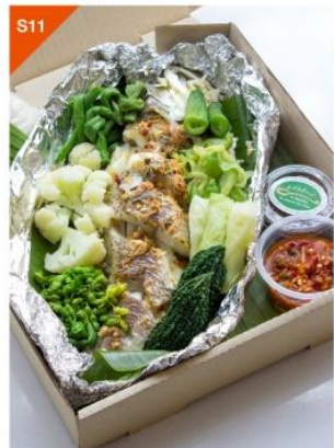
S11 ปลาช่อนึ่งแจ่ว + ข้าวเหนียว (สำหรับ 2 ท่าน) Steamed Fresh Water Fish and Vegetables with Spicy Dip and Sticky Rice 500.- 450.-