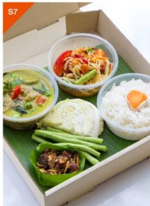
S7 ข้าวมันส้มตำ Somtum Thai, Chicken Green Curry, Sweet Pork / Beef with Coconut Rice 320.- 250.-