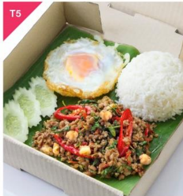
T5 หมูสับ-กุ้งแดงพัดใบกะเพราป่า + ไข่ดาวกรอบ + ข้าวสวย Phad Krapao Pork-Shrimp with Fried Egg and Rice