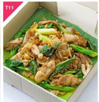
T11 พัดซีอิ๊วคั่วไก่ Phad See-Eew Chicken