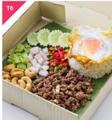
T6 หมูสับคั่วหน้าเสียบ + ไข่ดาวกรอบ + ข้าวสวย Stir Fried Pork and Salted Black Olives with Fried Egg and Rice