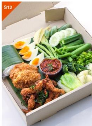
S12 น้ำพริกปลาร้าสับ+ปีกไก่ทอดงา + หมูตุ๋น+ไข่ต้ม+ข้าวเหนียว Namprik Pla (Anchovy Chili Dip) + Crispy Sesame Chicken + Crispy Marinated Pork + Vegetables + Sticky Rice 290.- 199.-