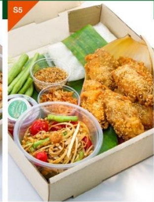
S5 ปีกไก่ทอดงา + ส้มตำหัวปลี + ข้าวเหนียว Crispy Sesame Chicken with Banana Blossom Somtum and Sticky Rice 250.- 199.-