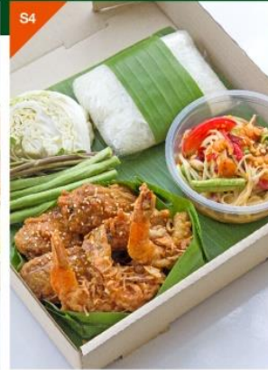
S4 ปีกไก่กรอบและกุ้งกรอบซอสขิง + ส้มตำไทย/ปูเค็ม + ข้าวเหนียว Crispy Ginger Chicken and Shrimp with Somtum Thai or Salted Crab and Sticky Rice 250.- 199.-