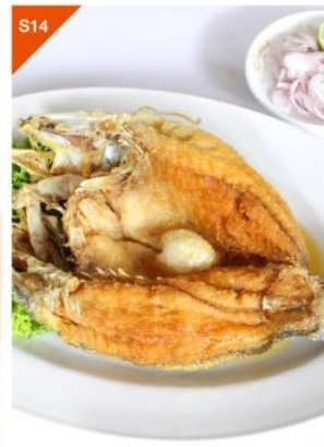
S14 ปลากระพงราดน้ำปลา Fried Sea Bass with Sweetened Fish Sauce 550.- 399.-