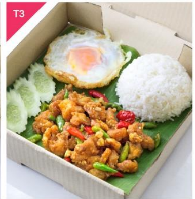
T3 ข้าวไก่กรอบพริกขี้หนูสวน + ไข่ดาว + ข้าวสวย Spicy Flavored Crispy Chicken Knuckles with Fried Egg and Rice