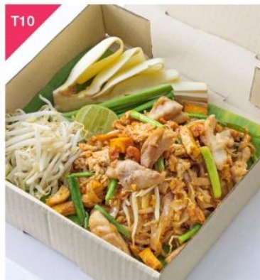
T10 พัดไทยคั่วไก่ Phad Thai Chicken