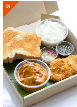
S9 มัสมั่นไก่/เนื้อ + ทอดมันกุ้ง + ขนมปังปัง + ข้าวสวย Chicken or Beef Massaman and Crispy Shrimp Cakes with Toast and Jasmine Rice 320.- 250.- 345.- 290.-