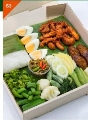
S3 น้ำพริกหนุ่มเมืองกรุง + ข้าวเหนียว (สำหรับ 2 ท่าน) Namprik Noom with Assorted Meat and Vegetables 320.- 199.-