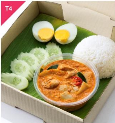
T4 แกงคั่วหน่อไม้ดอง (พริกแกงทำเอง) + ไข่ต้ม + ข้าวสวย Chicken-Bamboo Red Curry with Boiled Egg and Rice